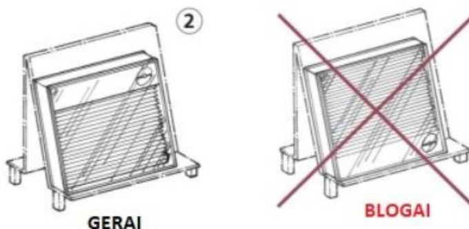
2 pav. Žaliuzių, kurių juostelės turi TIK vartymo funkciją, mechanizmo orientacija transportavimo metu